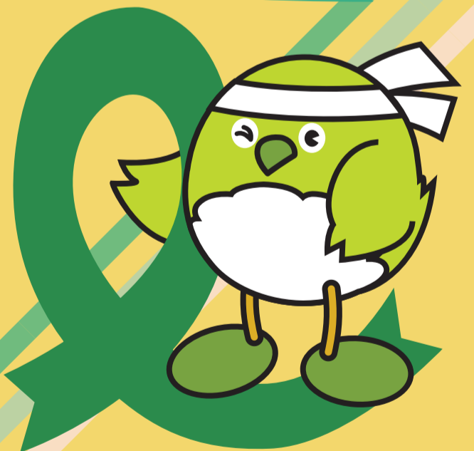
大分県応援団「鳥」「めじろん」 めじろん大分県662号